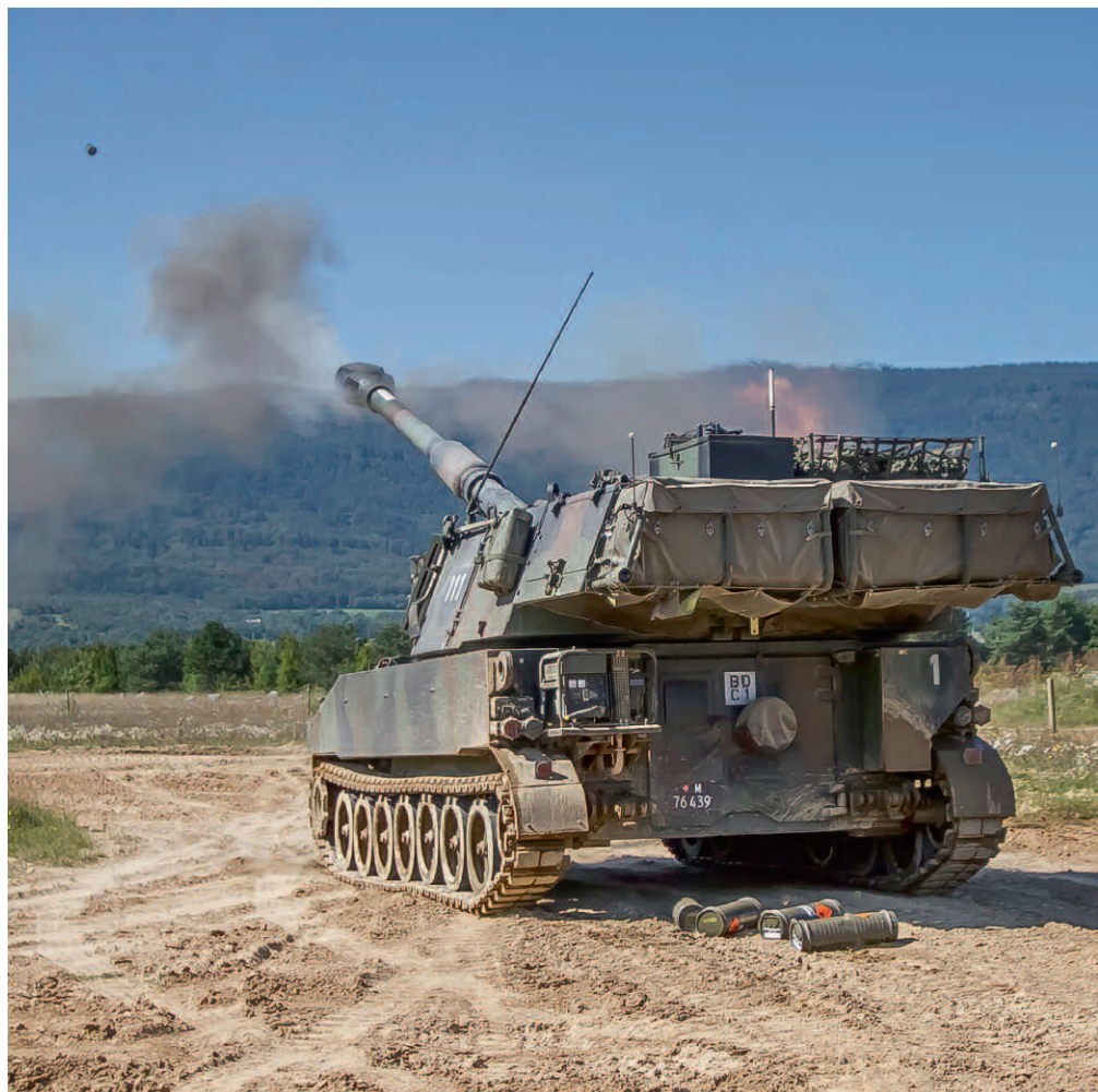
Die Panzerhaubitze M109 – hier in Bière – gilt noch immer als valables Geschütz.

hen Ausrüstungszustand der regulären russischen Truppen überrascht. Die Anhänger der These, dass Kriege mit territorialen Ansprüchen im friedensverwöhnten Europa der Vergangenheit angehörten, wurden eines Besseren belehrt.