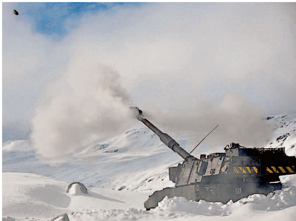
Artillerie heute: M109 im Gebirge.

Auch muss über eine Rohrverlängerung respektive über eine Erhöhung der Ladungen nachgedacht werden, so dass die Reichweite gesteigert werden kann. Bei ei-